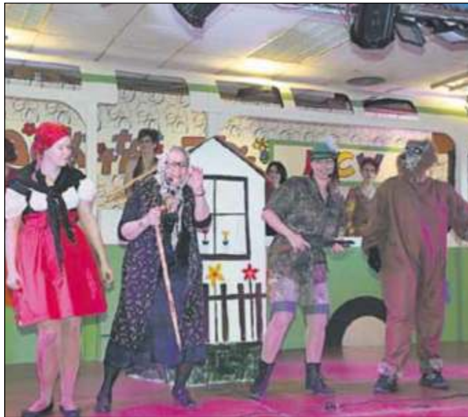
„Die wahre Geschichte von Rotkäppchen“