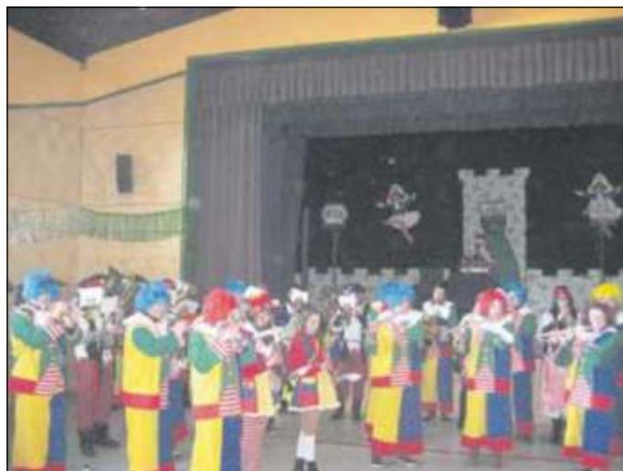
Beim gemeinsamen Abschluss mit den Musikfreunden aus Mettlach

Vorschau Voraussichtlich werden wir am Samstag, dem 24. April 2014 unsere Telefonbuchaktion durchführen.